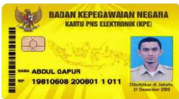
Specimen Kartu PNS Elektronik